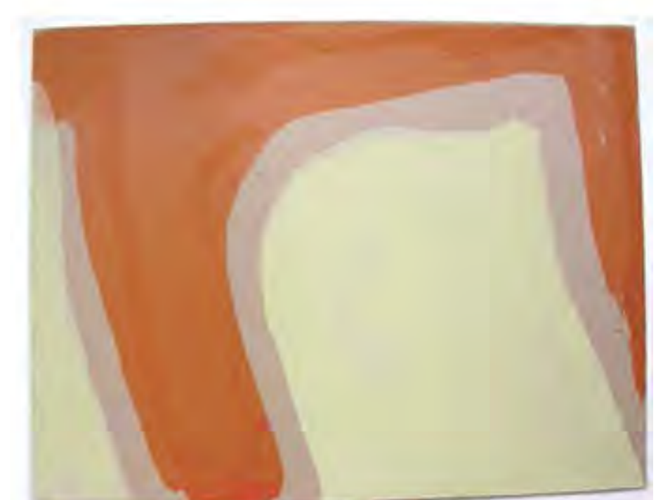
«Sans Titre» sur carton 400 g 32,5 x 25 cm