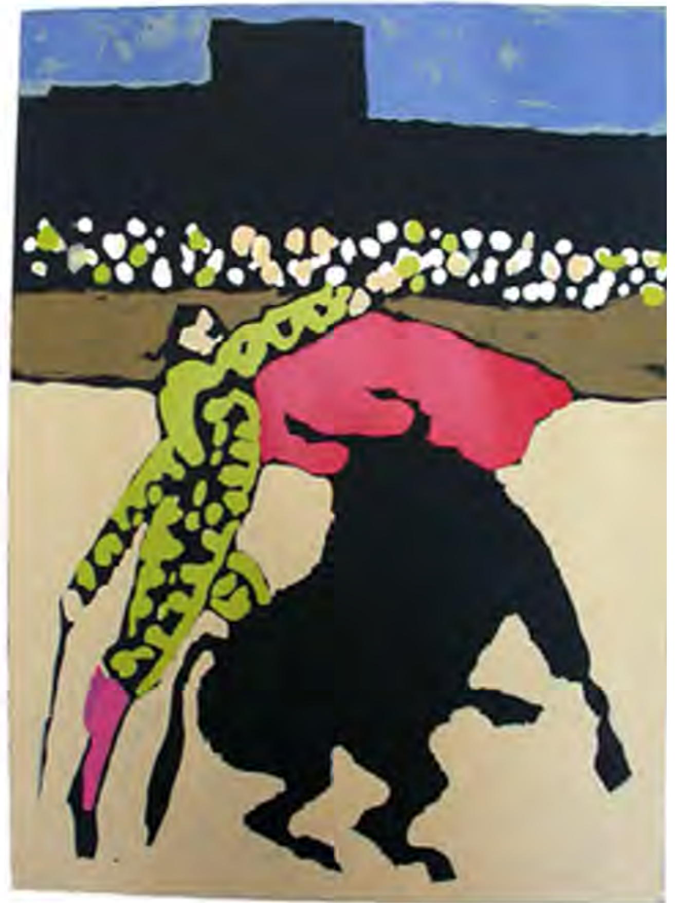
tienta d'Aubais 2011

48 x 59 cm sur chromolux noir 250 g 8 passages de couleurs juillet 2013 au dos à droite