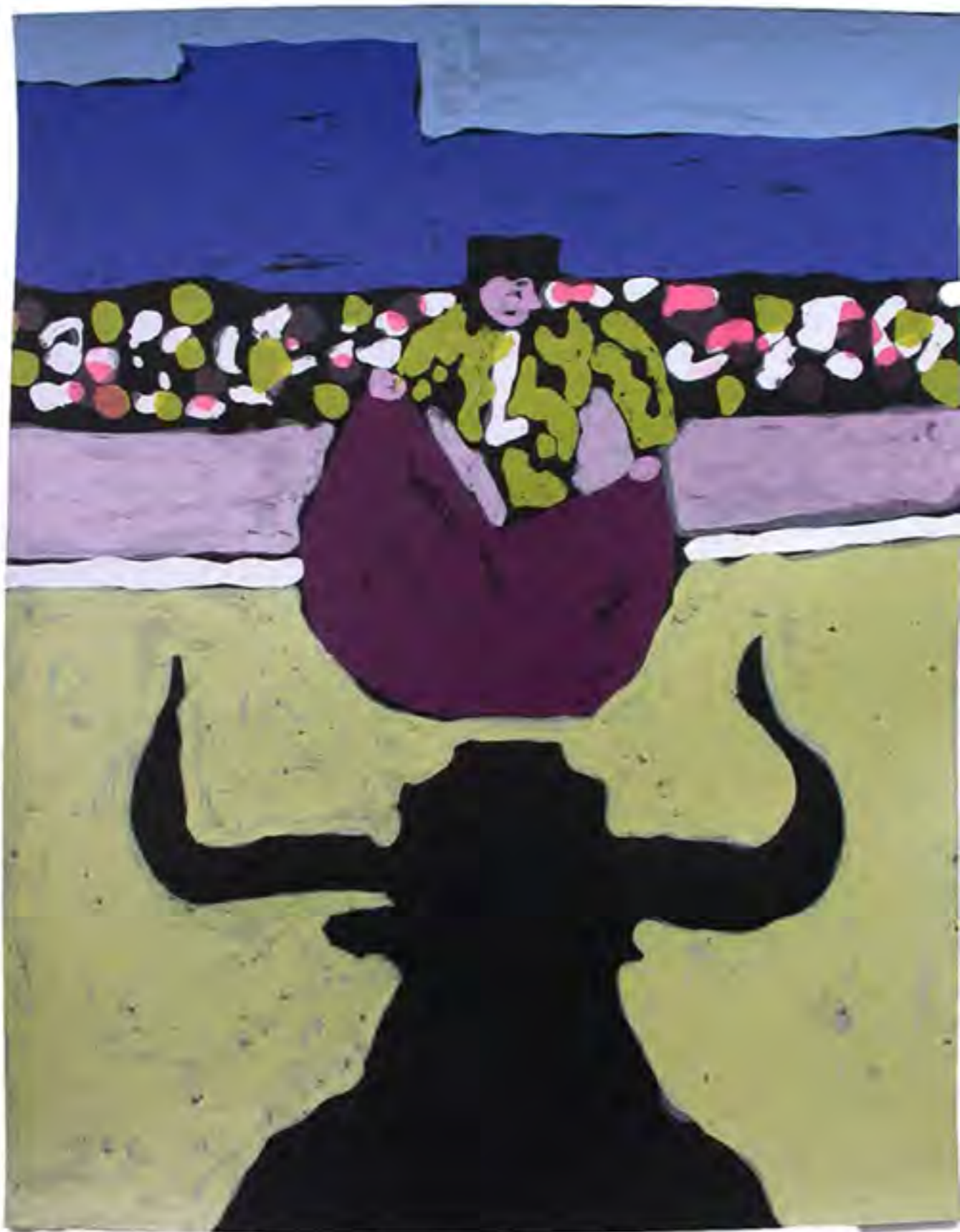
tienta d'Aubais 2012