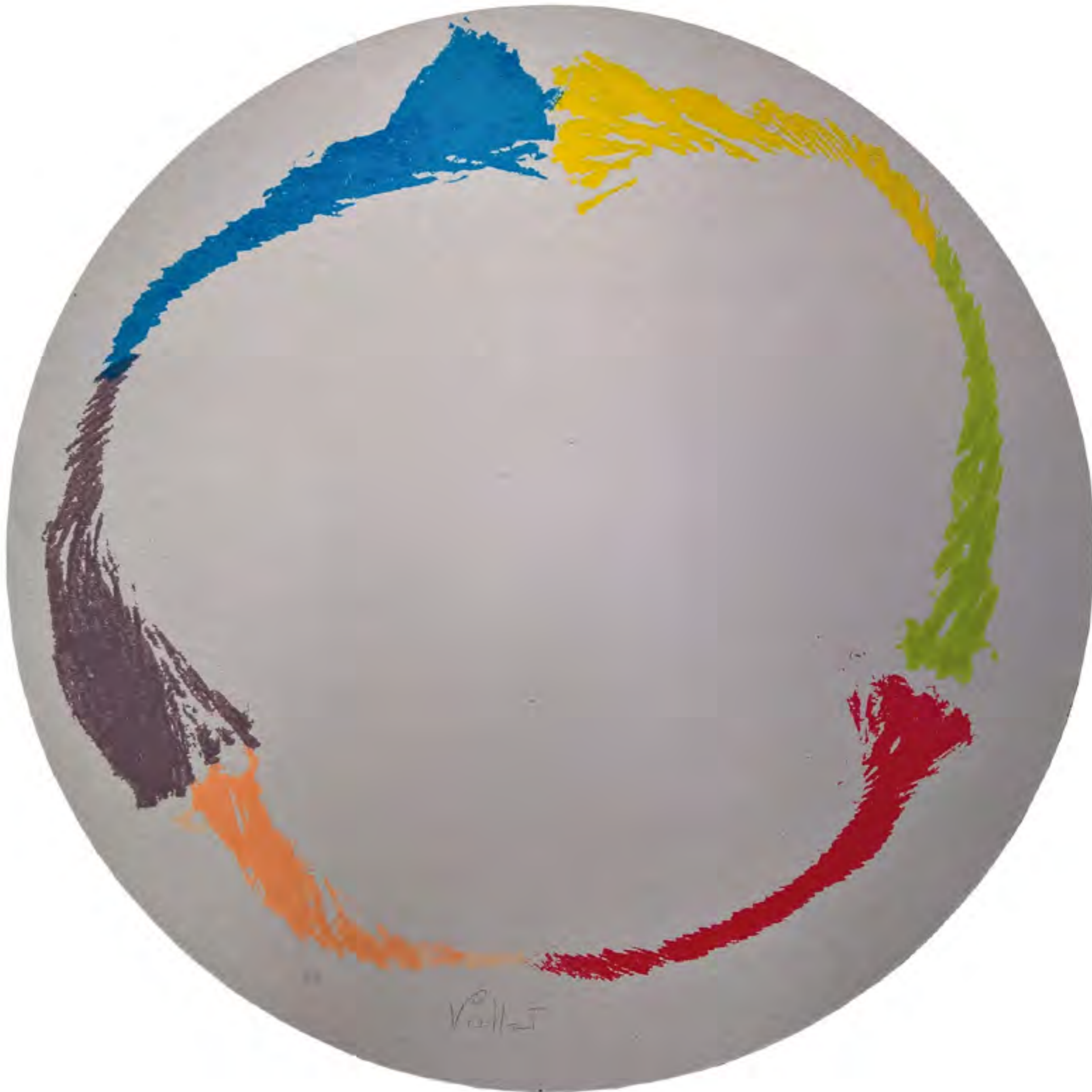
«Sans Titre» sérigraphie originale signée et numérotée imprimée à la main en 12 passages de couleurs à 30 exemplaires + 6 en chiffres romain 90 cm de diamètre sur carton gris de bobine juin 2017 les Amis du Mamac, Nice 2000 euros