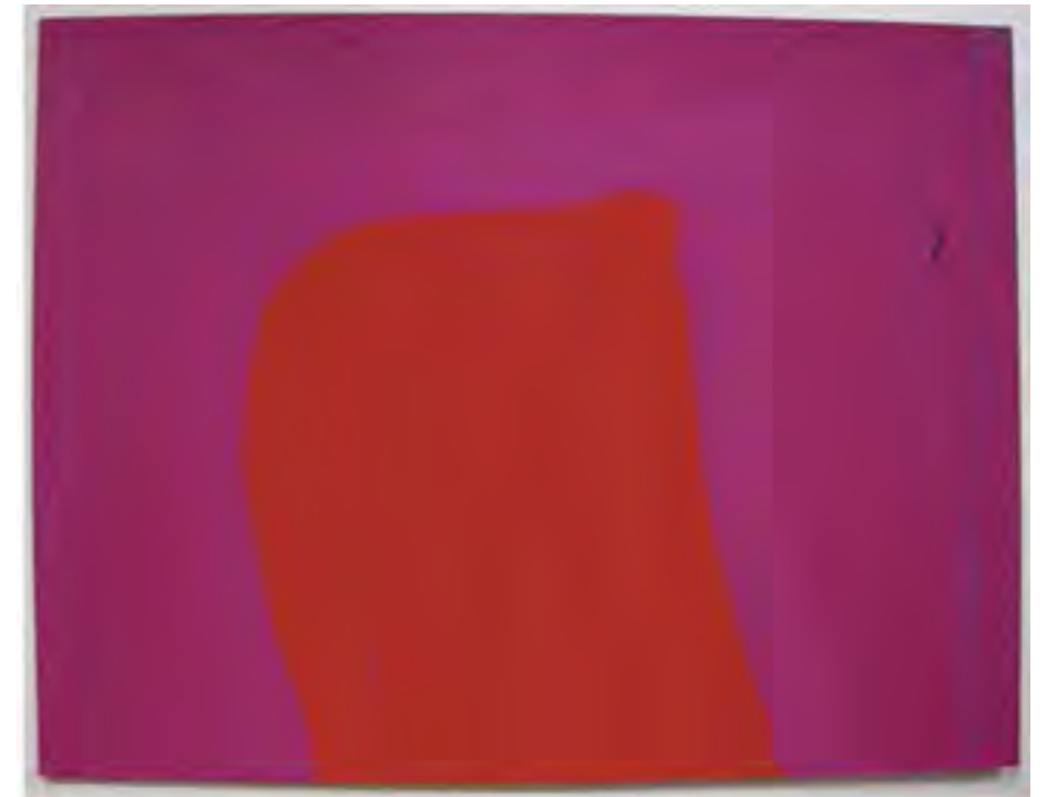
«Sans Titre» sur carton 400 g 32,5 x 25 cm