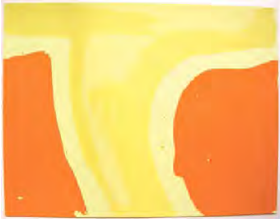
«Sans Titre» sur carton jaune 130 g 32,5 x 25 cm