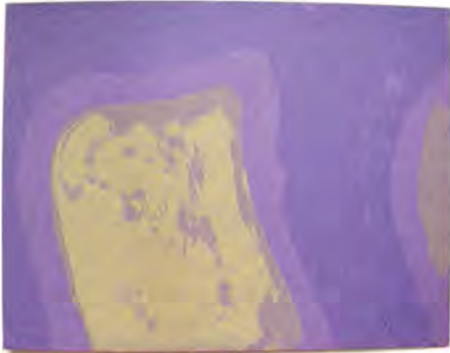
«Sans Titre» sur carton 400 g 32,5 x 25 cm