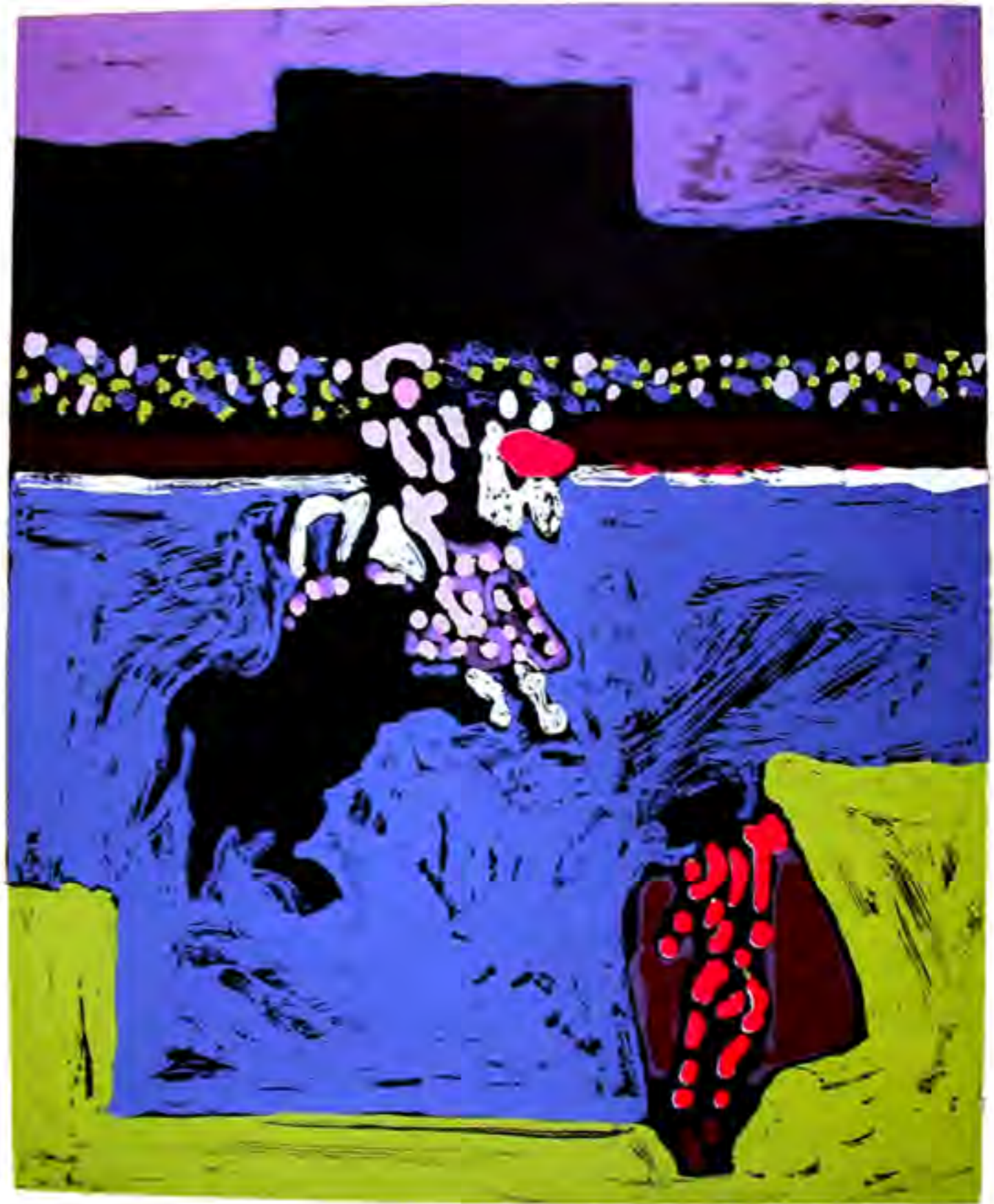
tienta d'Aubais 2013